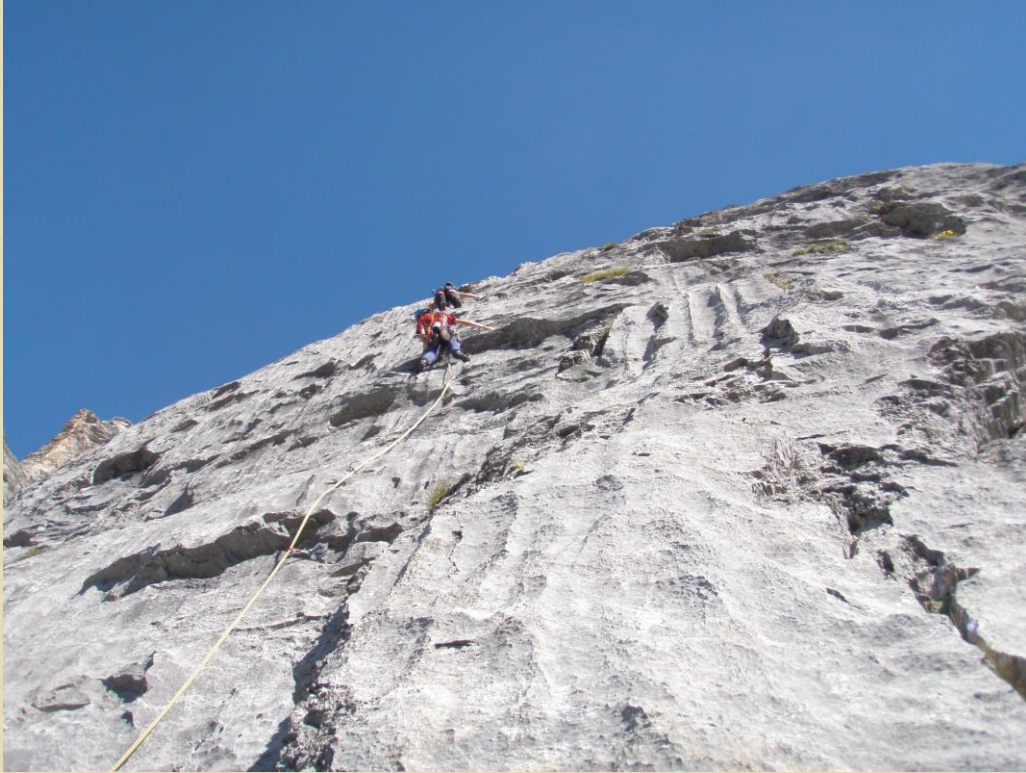
I tiro, roccia già super