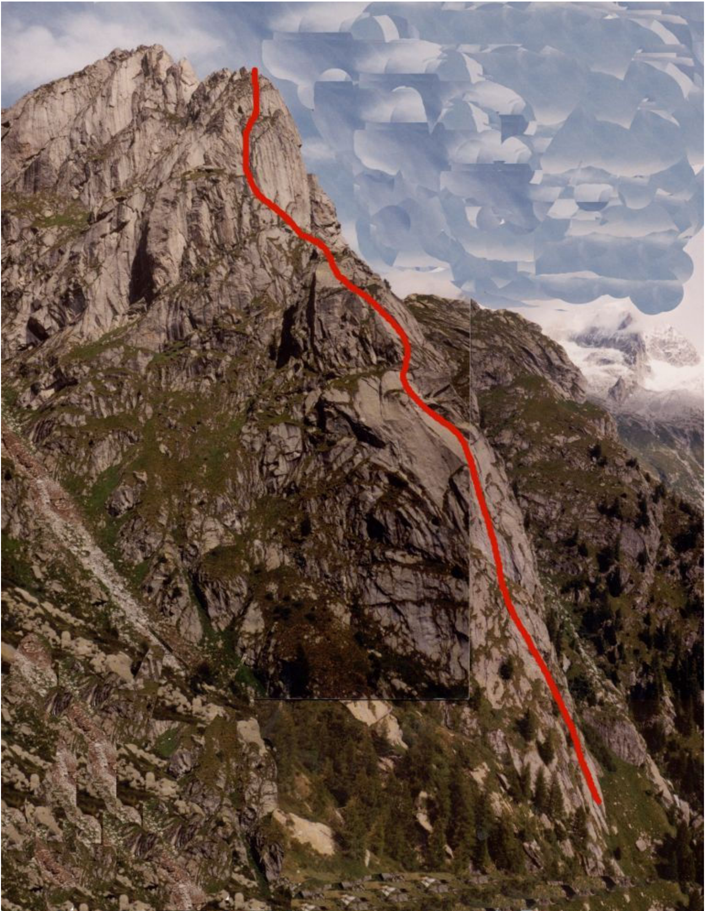
Lo sviluppo della via