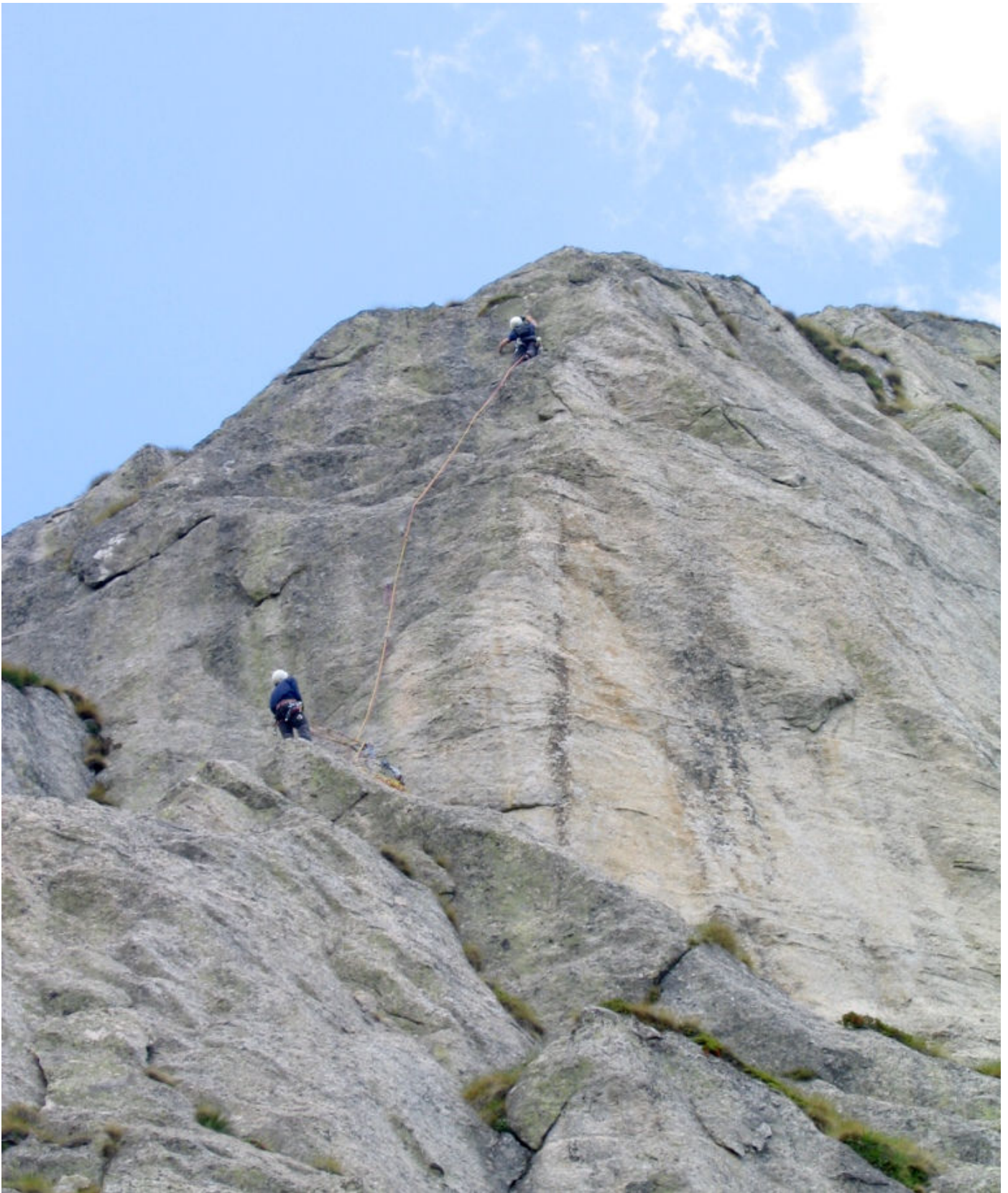
In apertura sul 12° tiro