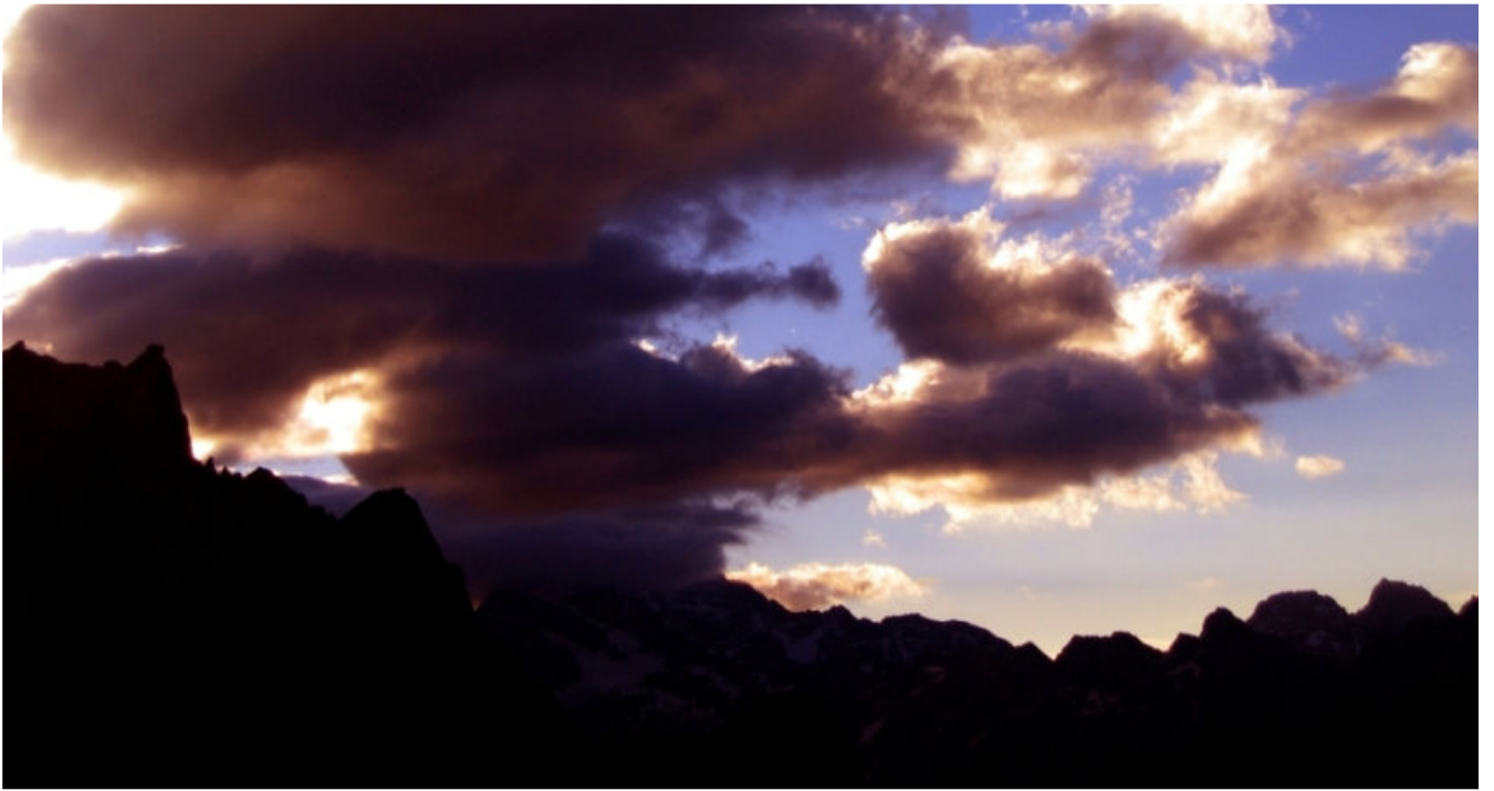
Alba dal rifugio Omio