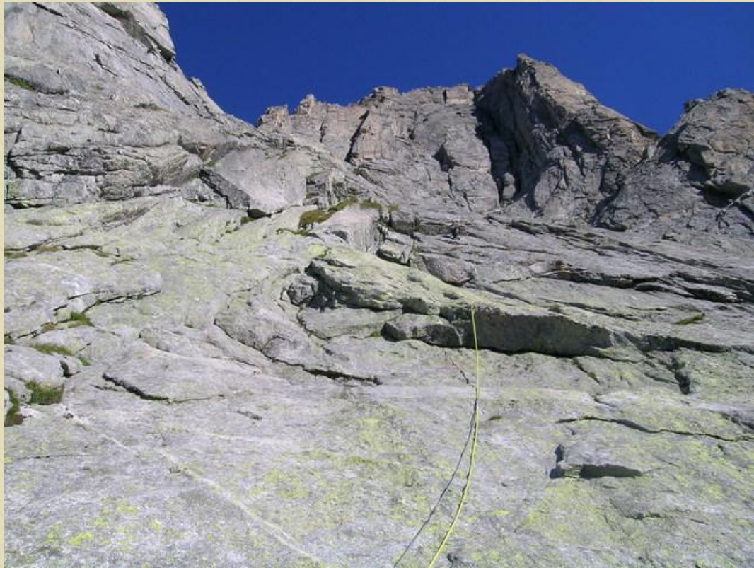
VI facile tiro