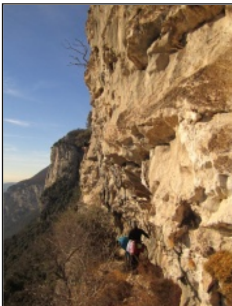
Sulla cengia per l'attacco della via. Sullo sfondo una cordata impegnata sul primo tiro