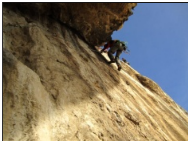
In uscita del tetto del terzo tiro