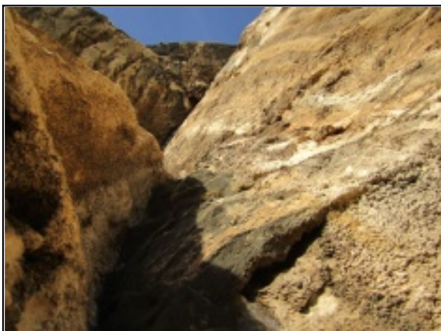
Il diedro del secondo tiro