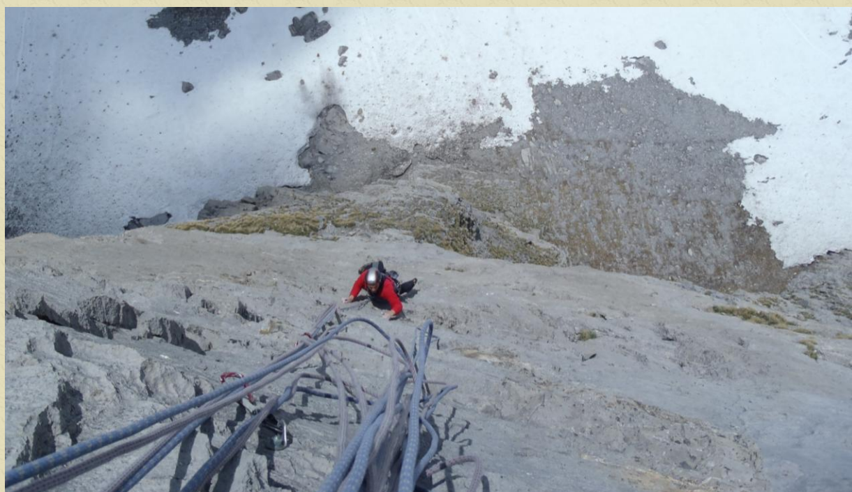
La parte alta della via (L4), molto bella