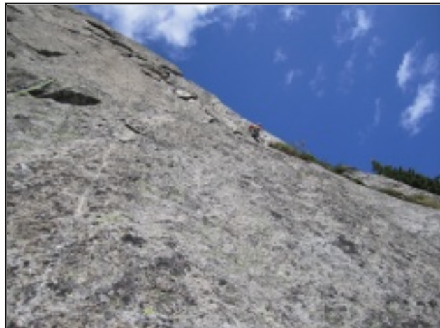
Sulla Steinfressen (quinto tiro della via)