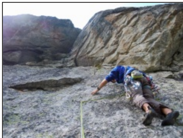
Il tetto del terzo tiro