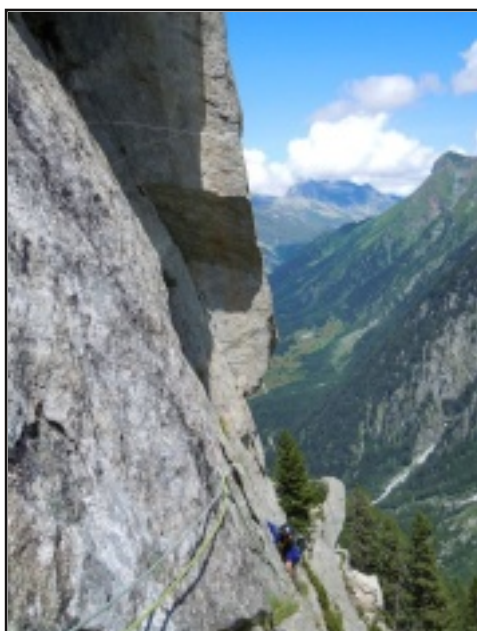
Il traverso del secondo tiro