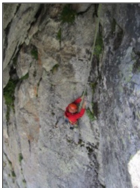
Prima del tetto del terzo tiro