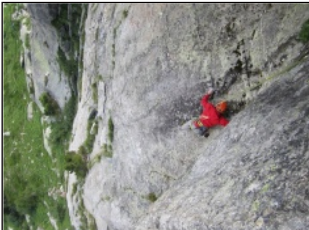
Placca del terzo tiro