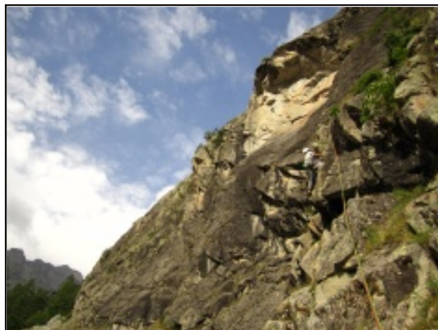
Pilastrino del secondo tiro