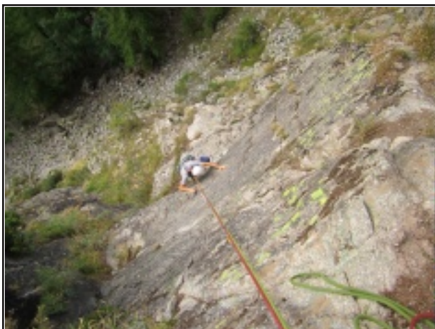
Placca del primo tiro