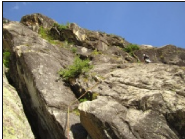
Il secondo tiro (visibile il primo spit)