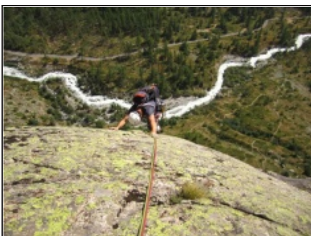
Uscita del quinto tiro